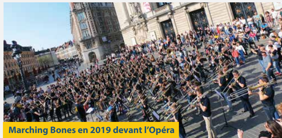
Marching Bones en 2019 devant l'Opéra

Répartis en plusieurs petits groupes selon les niveaux, chacun y trouve matière à progresser et à prendre du plaisir. Qu'il soit débutant, en pôle sup' ou plus, les partitions d'orchestre sont adaptées à chaque niveau. Nos plus jeunes stagiaires ont 6 ans.