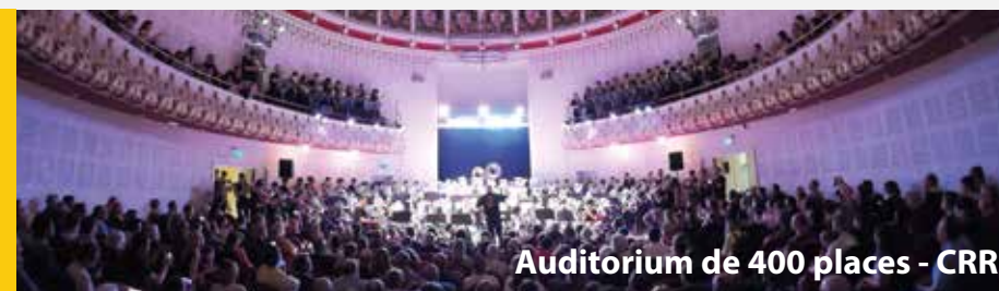
Auditorium de 400 places - CRR