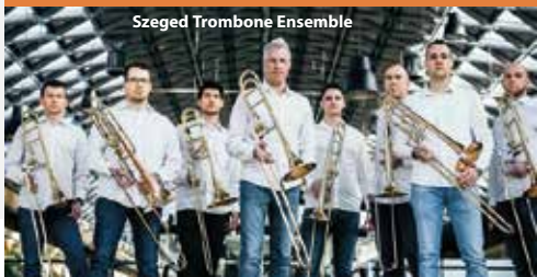
Szeged Trombone Ensemble